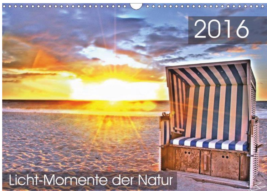
„Licht-Momente der Natur“ von Benno Hummelmann

Ein starkes Bild ist gut, reicht allein aber nicht.